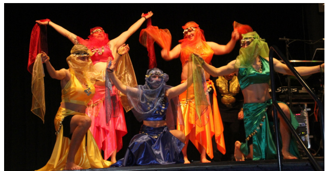
Sogar ein Harem wurde in die Mitternachtsshow eingebaut