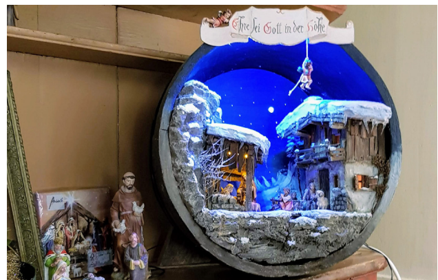
aus dem Krippenstüble der Familie Fink Hohenweiler