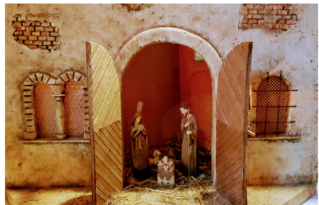
eine Krippe aus der Weinstube Bernhard Lochau

Zusätzlich zu unseren beiden Krippenausstellungen in Hohenweiler und Hörbranz hatten wir heuer auch die Aktion Krippeleschauen. Sie findet ja bekanntlich jedes 2te Jahr statt. Diesmal waren auch Teilnehmer aus Hörbranz und Lochau dabei. Ebenso hat auch Innermontafon heuer erstmals die Aktion Weihnachtskrippe übernommen. Das „Krippeleschauen“ hat in Tirol ja eine lange Tradition - vielleicht gewöhnt man sich auch in Vorarlberg mit der Zeit an offene Türen, wenn vermehrt Familien mit ihrer Krippe teilnehmen.