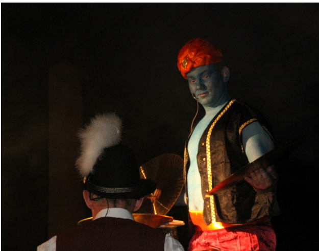
Flaschengeist der Mitternachtsshow